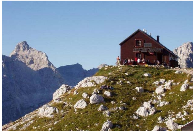
Zasavska koča na Prehodavcih