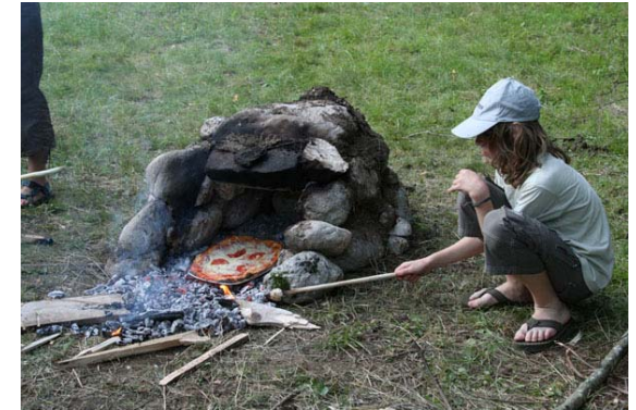
Pino čuva pizzo, Bovec 2008